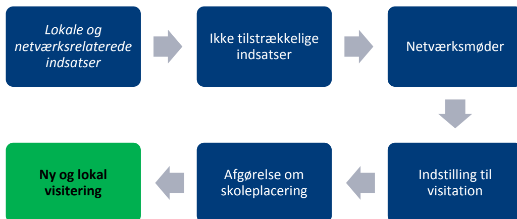
Figur 1 - Grafisk fremstilling af visitationsproces beskrevet i "5.a kriterier og procedure"

Visitationsprocessen kan grafisk fremstilles således: